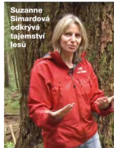
Suzanne Simardová odhaluje tajemství lesů